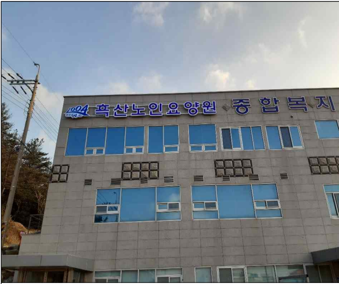
흑산노인요양원 설치 사진